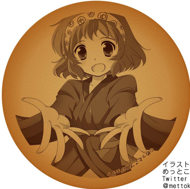
クッキー出来上がり原寸大 (直径約8センチ)

イラスト提供 めっとこプロジェクト Twitter : @mettoko_pjt