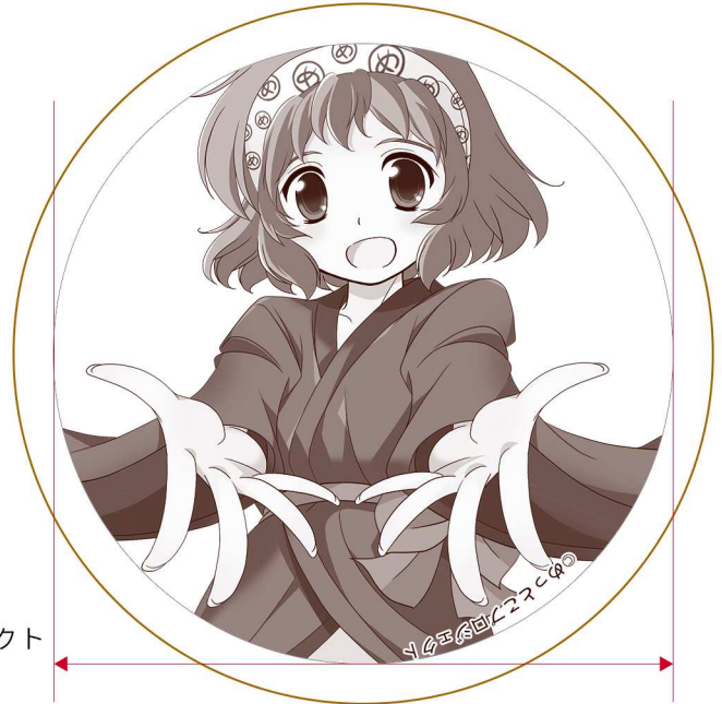
印刷範囲 (直径7.5センチ)

イラスト提供 めっとこプロジェクト Twitter : @mettoko_pjt